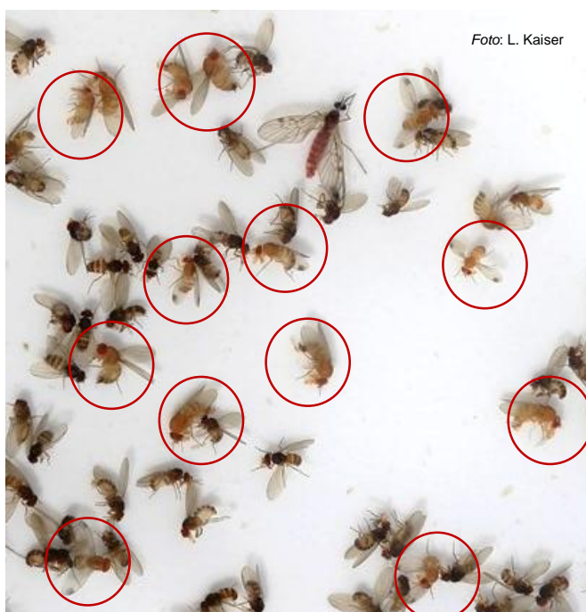
Flügelzeichnungen verschiedener Drosophila -Arten

Nur dieser Flügel gehört einer männlichen D. suzukii